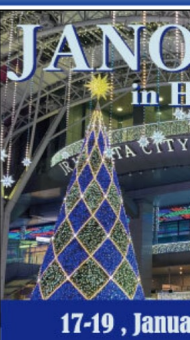
JANOG53は LINE株式会社 開催します。

開催日程: 2023年7月5日(水)~7日(金) 開催場所: 長崎県長崎市 参加費: 無料(本会議) ホスト: 株式会社イーサイド、長崎県立大学、株式会社長崎再興